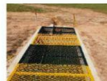
Fabricación e Instalación de skimmer