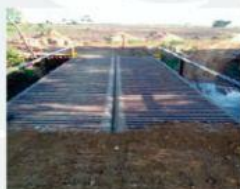
Instalación de Puente Metálico