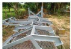
Pasareal indus (escalera)